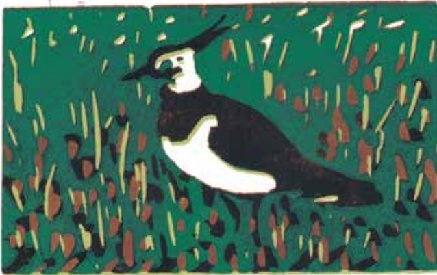
Kievit ( Vanellus vanellus ).