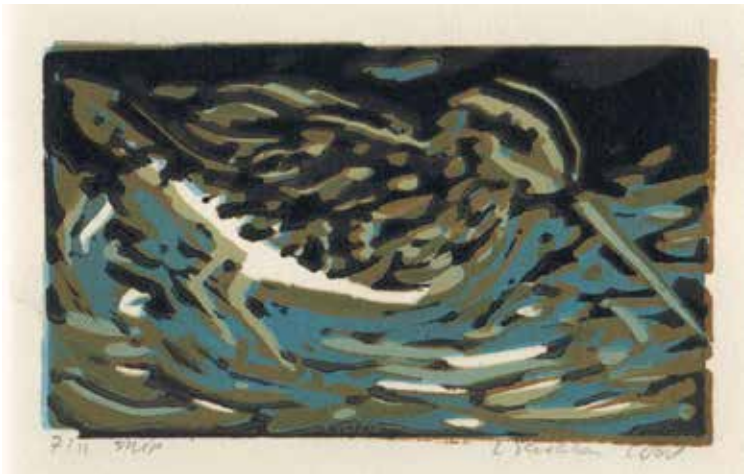
Watersnip ( Gallinago gallinago ).