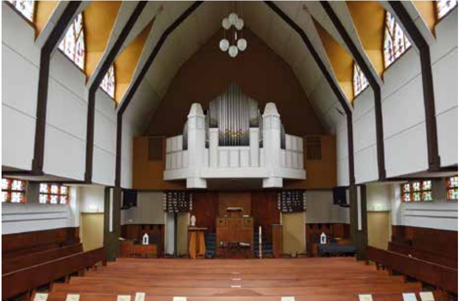
Het front, zoals Eversdijk het in 1940 in de Goede Herderkerk plaatste, en zoals het er nu nog steeds staat.

Op de hoek van de Burgemeester van Engelenweg en de Oosterlandenweg in IJsselmuiden staat het gemeentelijk monument de Goede Herderkerk. Achter een soort van 'pijpenhek' boven de kansel staat nog een oud pijporgel, dat sinds 1984 buiten gebruik is. Het genoemde pijpenhek maakt daar eveneens deel van uit. Het orgel is in 1940 in de kerk geplaatst. Het is echter beduidend