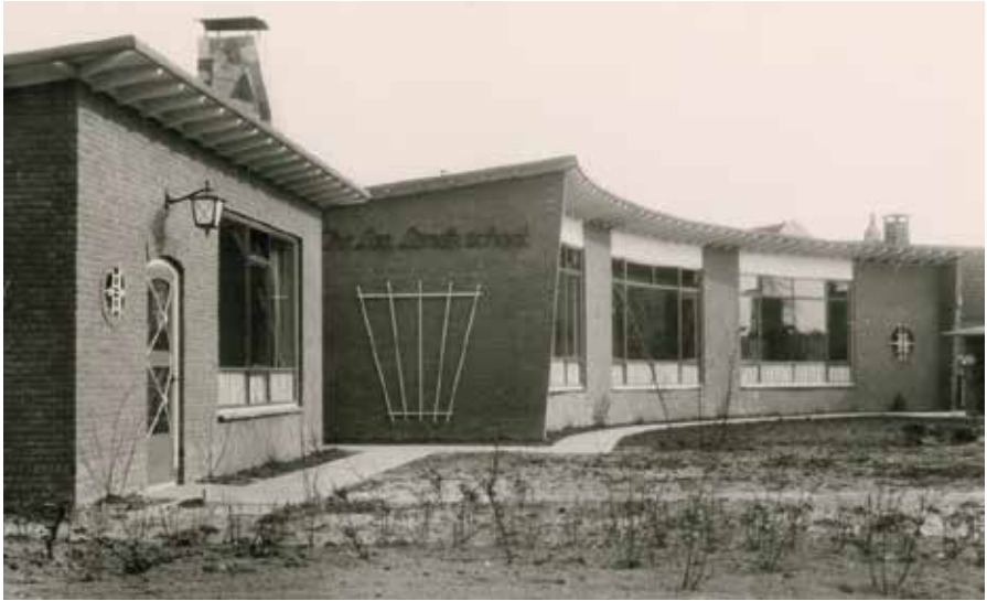
De Christelijke Lagere Landbouwschool aan de Spoorakade. jaren vijftig.

bouwen tijdens de wederopbouwperiode. In aanvng bestond de in de ronding van de Spoorakade gebouwde school uit een hal waaraan een kamer voor het schoolhoofd grensde, een laboratorium, een leslokaal, een mensa en een melklokaal. Een gebogen gang met garderobes en toiletten verbond deze ruimtes. Uit een bouwaanvraag uit 1960 blijkt het gebouw dan al te klein. Als gevolg krijgt het een nieuwe hoofdingang aan de oostzijde met een trappenhuis, een berging, een waslokaal en een praktijklokaal. Op de eerste verdieping, boven deze nieuwe vleugel, wordt een lerarenkamer en een overblijflokaal gerealiseerd.