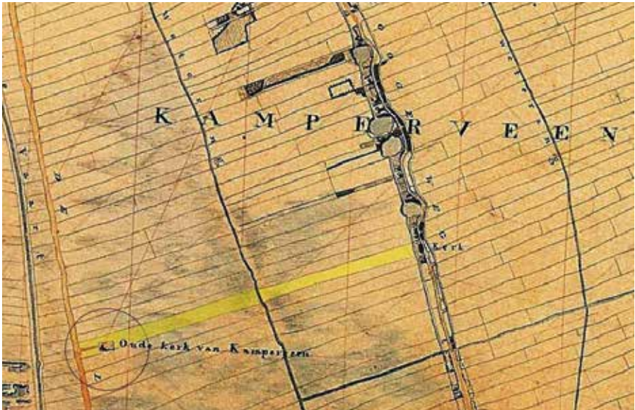
Het veen van Kamperveen is vanaf de Gelderse Gracht ontgonnen. Van links naar rechts, de Gelderse Gracht, de historische Leidijk, de Binnenwetering en de Hogeweg. De nieuwe kerk aan de Hogeweg werd in dezelfde slag als de oude kerk bij de Dompe opgericht (zie gele markering). Topografische kaart van Maximiliaan Jacob de Man, 1812.

hier te werken en te wonen. De nederzetting werd verlaten, maar de begraafplaats werd nog tot 1904 gebruikt.