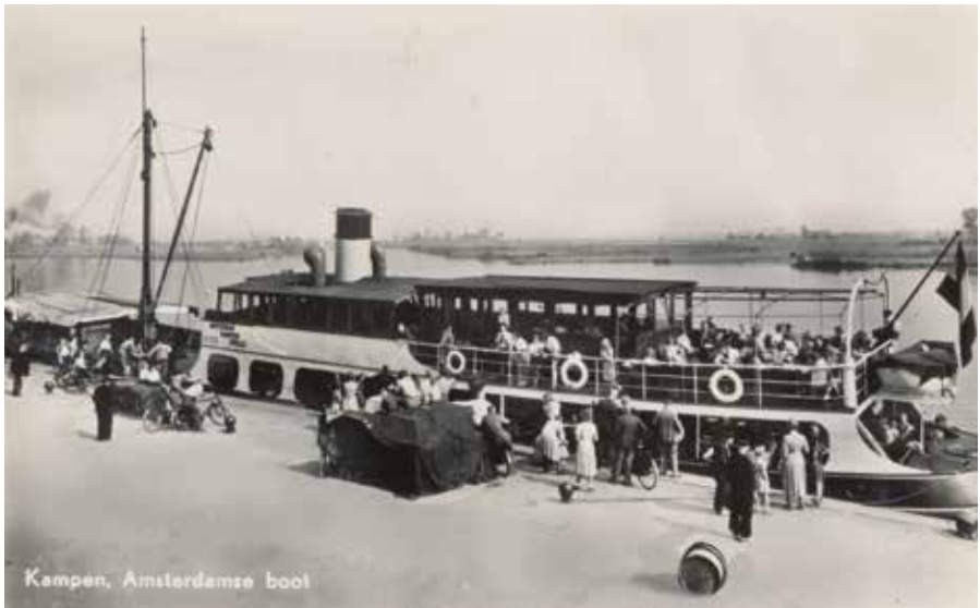
De IJsselkade, waar de bootdienst Kampen-Amsterdam aanlegde.

Ofschoon Arie geen uitgebreid verslag deed van zijn uitstapjes naar Amsterdam, werd wel duidelijk wat hij er, behalve cafés en drank, zocht. Voordat hij op de boot stapte, nam hij ook altijd het volgens hem vereiste krachtvoer, in de vorm van een paar rauwe eieren (in die tijd wel vaker gezien als poten-