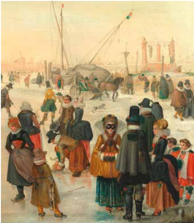
Ijsvermaak rondom een stenen galg (Kampen?), circa 1620. Schilderij (detail) van de Kamper schilder Hendrick Avercamp (1585-1634). Collectie Rijksmuseum Amsterdam.