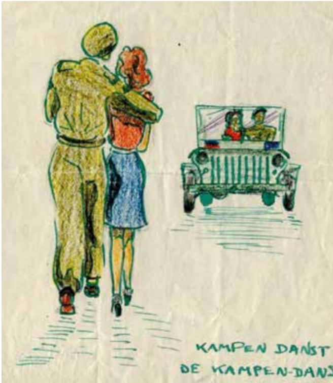
'Kampen danst de Kampen-dans'. Een krabbeltje bij een hot item in die tijd: de omgang tussen 'onze' meisjes en de Canadese jongemannen. Populair was het liedje Trees danst met een Canadees . Tekening van Wim Helleman uit 1945.

krantje verscheen direct na de bevrijding van Kampen in het openbaar en het had een enorm succes, mede omdat de kranten die in de oorlog waren doorgegaan een voorlopig verschijningsverbod hadden gekregen.