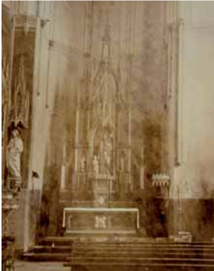
De Jozefkapel in de Buitenkerk, circa 1890; dus voor de veranderingen in 1911/12. Collectie: Archief O.L. Vrouwekerk Kampen.

in de archieven is overgeleverd, zal deze zeker afgegeven zijn. Voor alle handelingen van dien aard is immers (nog steeds) bisschoppelijke machtiging vereist. Met leedwezen wordt dan ook in het jaarverslag van de Rijkscommissie over 1912, zoals we al eerder zagen, geconstateerd dat de verkoop plaats vond 'niettegenstaande dezerzijds aan den Aartsbisschop van Utrecht was verzocht dien verkoop te beletten. Daar de herkomst, blijkbaar ter aanprijzing, bij een en ander werd vermeld, moet verondersteld worden, dat deze verkoop plaats had met medeweten en goedvinden der kerkelijke overheid'. Het geeft ook tegelijkertijd het dilemma weer waar de