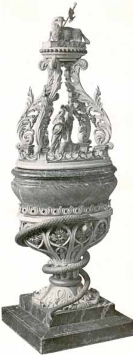
Het in 1912 geveilde doopvont uit de Buitenkerk. (uit: veilingcatalogus A. Mak oktober 1912).

eeuw had deze gekerkt in een tweetal schuil- of huiskerken. In 1681-1682 realiseert de pastoor te Kampen een huiskerk in een voormalige brouwerij gelegen aan de Rijnvischgang met een pastorie aan de Burgwal. Later volgen de paters Franciscanen met een huiskerk nabij de Blauwehandsteeg, achter hun pastorie aan de Voorstraat. 5