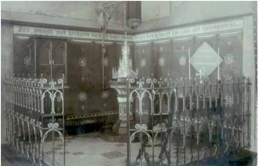
De in 1912 gerealiseerde doopkapel in de Buitenkerk.