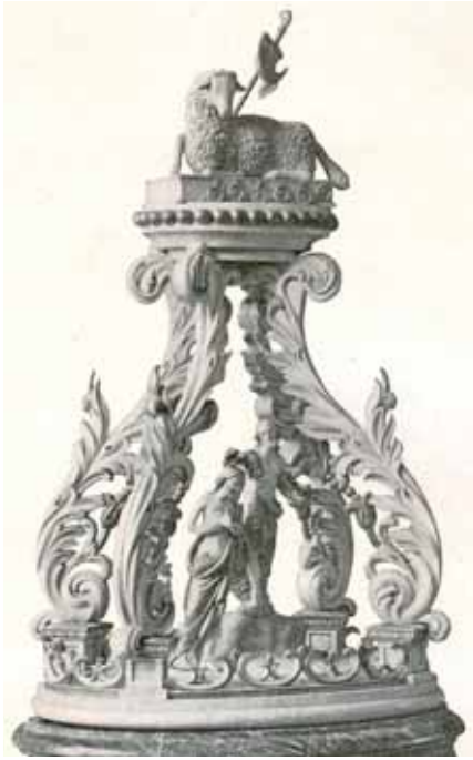
Deksel van het doopvont uit de Buitenkerk.