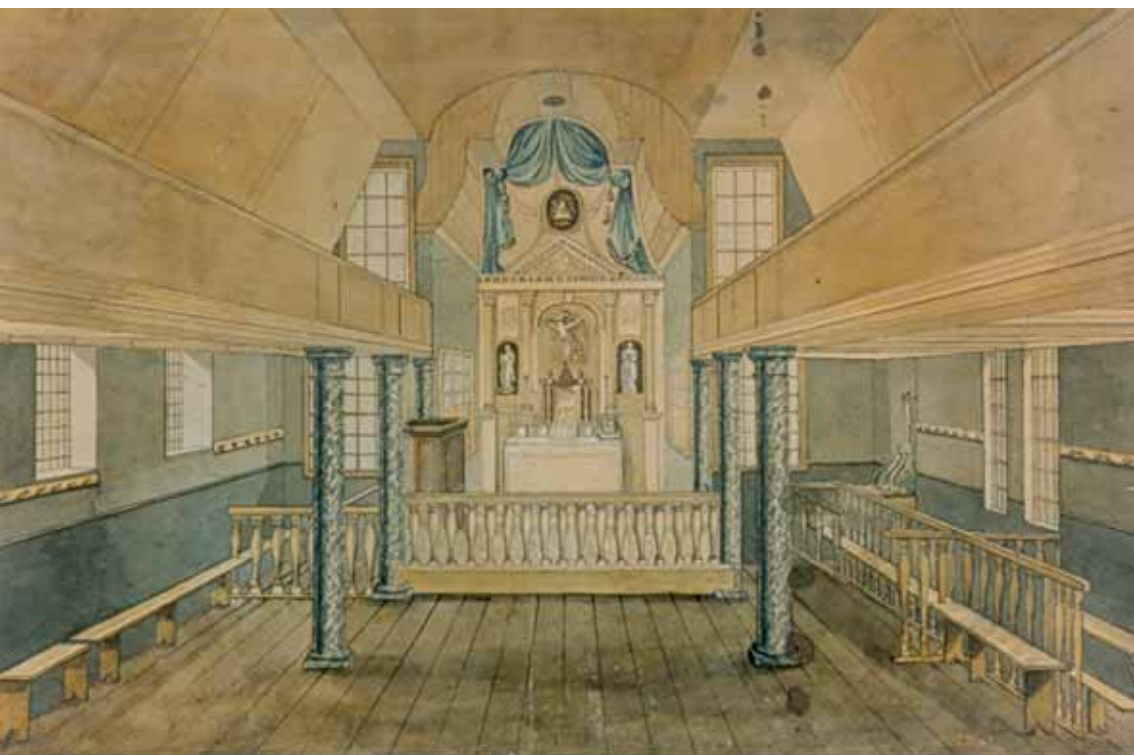
Interieur Pastoorskerk, circa 1810 (?); aquarel.

Collectie Archief O.L. Vrouwekerk Kampen; in langdurig bruikleen aan Stedelijk Museum Kampen.