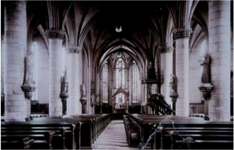
Interieur Buitenkerk circa 1930.

zandsteen vernieuwd en beglaasd', evenals later die in de zuidmuur. Verder worden de muren afgebikt, zo nodig hier en daar opgemetseld, bijgepleisterd en 'alles in eenvoudige kleuren getint'. In de vensters in de zijkapellen komen gebrandschilderde ramen uit het Utrechtse atelier H.A.M. Vos, in de triomfboog van het koor een groot triomfkruis. Ook in de rest van de kerk worden in de er op volgende jaren geleidelijk alle 'monsterlijke kazerne-ramen' - ijzeren roedenvensters, in 1844 onder pastoor Van den Nieuwen-tap aangebracht - vervangen door natuurstenen traceringen en voorzien van gekleurd glas-in-lood. De Zwolse kerkschilder A. Waterkamp brengt in deze jaren op allerlei plaatsen in de kerk figuratieve schilderijen aan. Met de komst van een nieuw hoogaltaar uit het atelier Mengelberg in 1926 en nieuwe banken in 1927, kan men stellen dat de restyling van de Buitenkerk tot een gebouw met een compleet neogotisch interieur voltooid is. 32