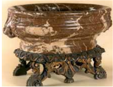
Koelvat, 18de eeuw, in de collectie van Museum Paleis Het Loo.

Het tweede koelvat maakt sinds 1989 deel uit van de collectie van het Museum Paleis Het Loo te Apeldoorn en staat thans opgesteld in de zogenaamde Nieuwe Eetzaal, die is ingericht naar de inventaris uit 1713. 18 Wederom is de wijnkoeler uitgevoerd in rood-bruin marmer, maar ditmaal geplaatst op een fraai, gedeeltelijk verguld, gebeeldhouwd voetstuk, dat een onmiskenbaar Nederlands karakter draagt. Het snijwerk van het voetstuk vertoont ornamenten die direct associaties oproepen met het werk van de bekende architect-ontwerper Daniël Marot (1661-1752). Deze Hugenoot, die in 1686 naar Den Haag uitwijkt, begon zijn artistieke loopbaan in Versailles, waar zijn vader Jean als architect en graveur werkzaam was. Daniël Marot was inventief en beschikte over virtuoos vakmanschap en had bovendien een reputatie als uitstekend organisator, die grote opdrachten efficiënt en op een voortvarende wijze tot een goed einde kon brengen. Na de dood van Willem III vestigt Marot zich in 1704 weer opnieuw in Nederland en wel in Amsterdam. Na het wegvallen van vorstelijke opdrachten heeft hij nu zijn handen vrij om in te gaan op de wensen van de regentenklasse. Tientallen jaren is zijn invloed in de Republiek alom vertegenwoordigd. Zijn ontwerpen gaan van stadspaleis tot deurknop, van hardstenen tuinvazen tot de vorm van een zilveren theepot. Zijn leven lang blijft hij trouw aan de Lodewijk-XIV stijl. In de provincie blijft zijn invloed soms tot aan het einde van de 18de eeuw waarneembaar.