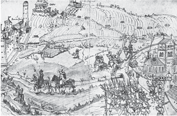
Abt en monniken vluchtend vanuit Weisenau naar Ravensburg. Afbeelding uit de Weisenauer Bauernkrieg Chronik van Jacob Murer.

Men ging te Kampen met een kar rond en er werd op een (koperen) bekken geslagen om in te zamelen. Er werd onder andere brood, vlees en geld ingezameld. Dit werd naar de behoeftigen te Harderwijk gezonden. 117