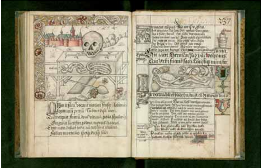
Afbeelding uit de Kamper codex in Russisch bezit (fo. 236v en 237r).

Op 22 september zijn kerken, kloosters, gasthuizen hun ornamenten, goud en zilver vernield. Kloosters werden verwoest. De kerkdienst werd afgelast en men predikte per week 3 preken, die op de voorschriften van Calvijn gestoeld waren, hoewel de graaf de augustanam confessionem [Augsburgse Belijdenis] beloofd had.