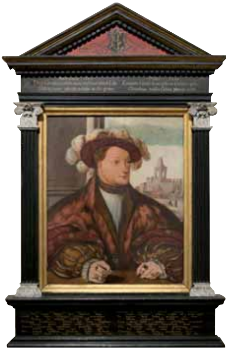
Hertog van Gelre: Karel van Egmond. Collectie Gemeentemusea Arnhem.

Marck. Men heeft vier van deze kapiteins [ter dood] veroordeeld. Ter glorie van de stad Kampen heeft men ongeveer 40 à 50 krijgslieden gevangen weten te nemen. Edoch, wanneer het leger van Kampen de volgende dag op oorlogspad was gegaan, had men het hele Gelderse leger, van 2½ duizend man, gevangen kunnen nemen; immers waren de Gelderse soldaten met pak en zak zwaar beladen en gezamenlijk in 2 of 3 Rijnschepen gepropt. Hierbij kwam nog het feit dat de Rijnschepen vastliepen op het zand en men ook niet door het ijs kon varen. Het gebeurde niet - God betert het -, het is bedroevend, die van Deventer daarover niet beraden waren . Ook al had Gelre kloosters en kraamvrouwen geschonden en alles geplunderd wat zij tegen waren gekomen. Deze krijgslieden zijn teruggekomen via zee voor onze Zomerdijk en hebben met berouw ons geschreven en zijn vervolgens richting de hertog van Gelre getogen, die zich opdat moment in Twente bevond. De hertog van Gelre was Twente binnengevallen en had het landschap gebrandschat.'