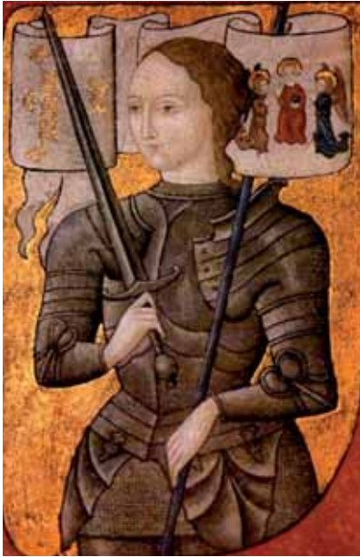
Jeanne d' Arc. Centre Historique des Archives Nationales (inv.nr. AE II 24900).

of the roses . Tijdens de slag bij Azincourt werd de Franse cavalerie door de Engelse longbow verslagen.