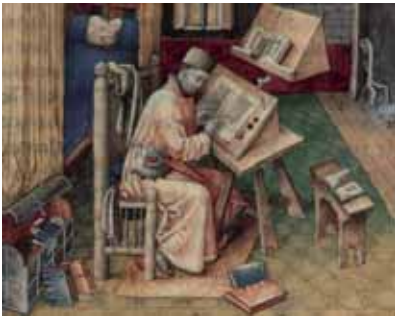
Afbeelding van een middeleeuwse schrijver (tweede helft 15de eeuw). Collectie Koninklijke Bibliotheek Brussel (MS 9278, fo. 10r).

De geschiedschrijving in de middeleeuwen heeft een aantal, in onze moderne ogen opvallende kenmerken. Geschiedenis werd als een lineair proces gezien. Dit hield in dat de geschiedenis een begin en een eind heeft. Voor de middeleeuwer was het begin bekend: de schepping van de aarde. Het begin, vanuit de Bijbel gezien, was dus bekend, het einde daarentegen was minder duidelijk; hoewel men vermoedde hoe het ging eindigen, namelijk zoals het beschreven stond in de Openbaring van Johannes. Men was vanuit dit standpunt gezien continu op zoek naar aanwijzingen in het verleden of heden die konden duiden op de wederkomst van Christus. Wonderen en belangrijke gebeurtenissen, die op de terugkomst van Christus zouden duiden, werden daarom ook opgetekend. Deze wonderen en gebeurtenissen moesten als puzzelstukjes dienen om het groter geheel duidelijk te kunnen maken.