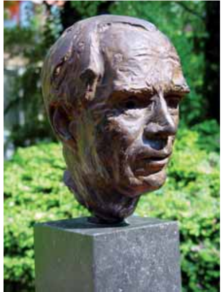
[Pieter d'Hont (1917-1997)]. Portretkop Henk van Ulsen. Brons, 30 x 20 x 23 cm. Ongedateerd.

zelfs een aantal eigenhandige aquarellen, die duidelijk aantonen dat Van Ulsens kwaliteiten, ondank zijn liefde voor kunst, niet op het beeldende vlak lagen.