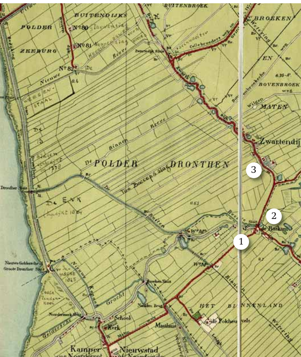
Het woongebied van de eerste generaties Twent, aangegeven op een bij Ph. Zalsman gedrukte topografische kaart van de gemeente Kampen, die is gebaseerd op verkenningen van eerste luitenant B. ten Broecke Hoekstra gedaan in 1902/1903. Schaal 1:25000. Collectie: Frans Walkate Archief. 1. De Naaldweg - 2. Plaats waar het veer over de Enk lag. - 3. De Zwartendijk.