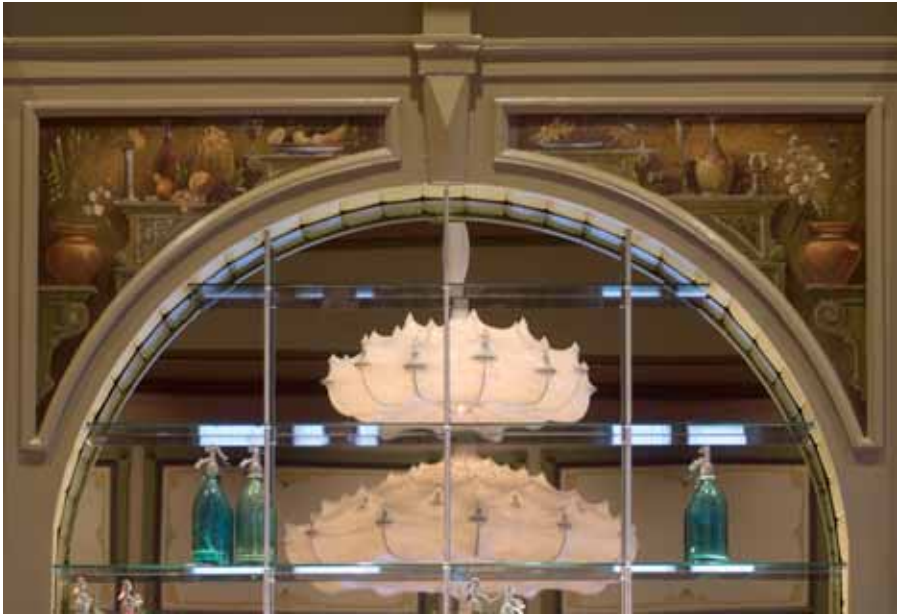
Het gereconstrueerde buffet met, in de zwikken van de boog, de gerestaureerde stillevens.