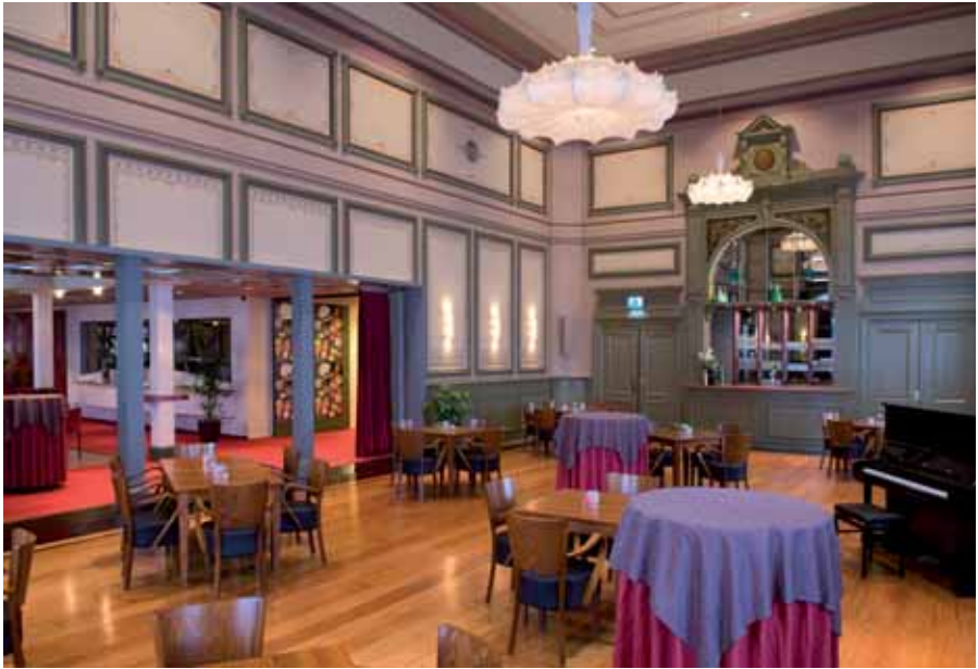
De gereconstrueerde foyer na de opening in 2008.

wandbeschilderingen aangetroffen, maar in de foyer wel. Sporen van deze veelkleurige periode met een geschilderde plafondindeling zijn bij het onderzoek als eerste afwerklaag op het plafond aangetroffen. De wandpanelen hebben sjabloonschilderingen en de wanden en lijsten zijn in meerdere kleuren geschilderd. De aard van de decoraties neigt sterk naar de Art Deco-stijl (vanaf 1914). Het jaar 1907 is dus wel wat vroeg voor deze toepassing! Deze afwerking heeft zeker tot en met 1947 bestaan, getuige enkele foto's uit die tijd, waar de sjabloonschilderingen op te zien zijn.