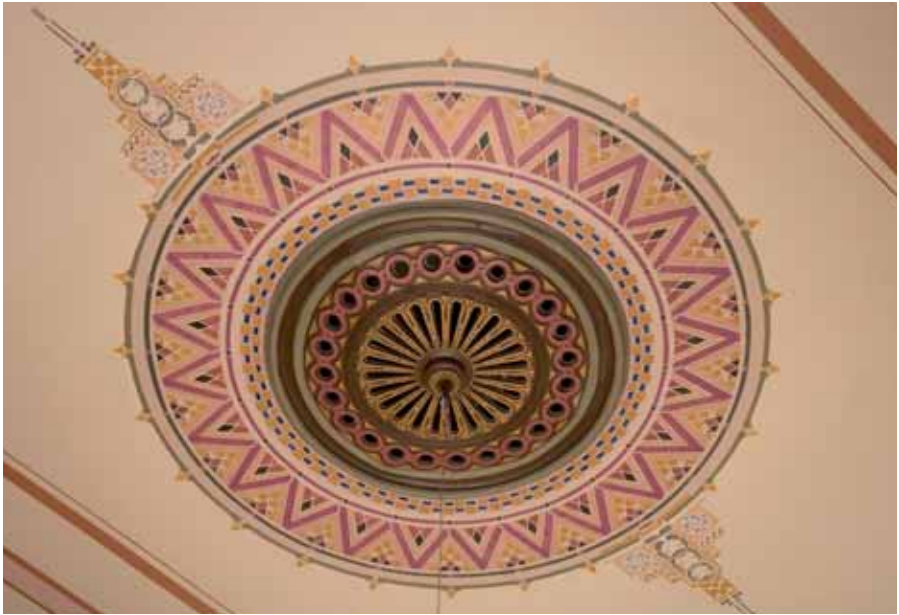
De gereconstrueerde plafondschildering uit 1907.

is die van 1907, toen plafond- en wandschilderingen aangebracht zijn. Resten van deze veelkleurige fase, met bloemschilderingen in de kooflijst van het plafond, zijn bij het onderzoek als eerste laag aangetroffen. Van enige kleurige afwerking, of van een kalklaag uit de bouwperiode (1890) is niets waargenomen. Wel wijkt de toneelwand bouwkundig af van de ontwerp-tekening uit 1890. De zuilen zijn omhoog en opzij gebracht en de decoraties wijken enigszins af van die van de koof. Het is dus ook mogelijk dat de basiskleuren en koofschilderingen rond het toneel in 1907 zijn aangepast.