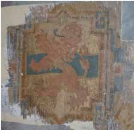
Fragment van blootgelegde schildering, met het wapen van Overijssel. Collectie Gemeente Kampen.

Elk gebouw heeft zijn eigen kleurgeschiedenis, zowel wat betreft het exterieur als het interieur. De ervaring leert dat de historische afwerkingen