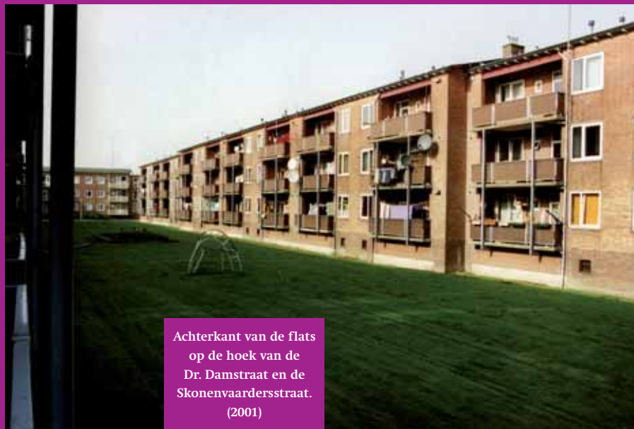
Achterkant van de flats op de hoek van de Dr. Damstraat en de Skonenvaardersstraat. (2001)