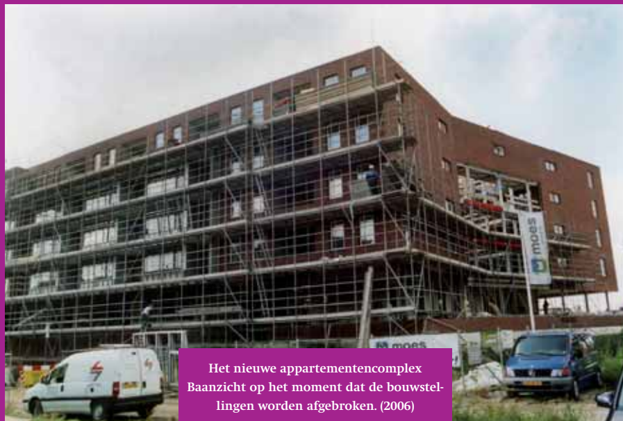
Het nieuwe appartementencomplex Baanzicht op het moment dat de bouwstel- lingen worden afgebroken. (2006)