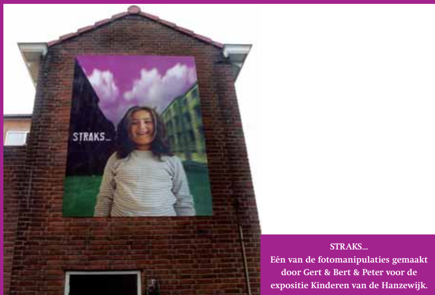
STRAKS... Eén van de fotomanipulaties gemaakt door Gert & Bert & Peter voor de expositie Kinderen van de Hanzewijk.