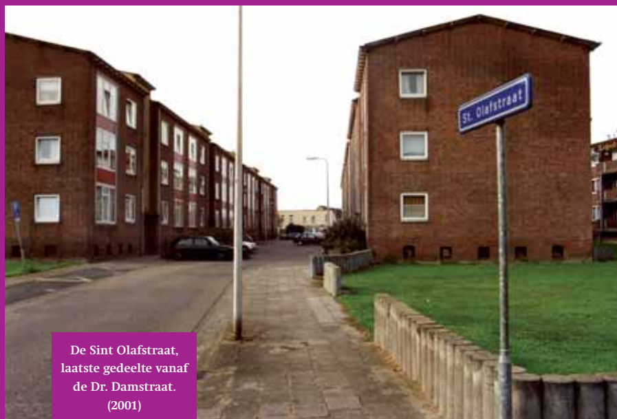
De Sint Olafstraat, laatste gedeelte vanaf de Dr. Damstraat. (2001)