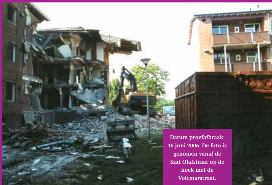
Datum proefafbraak: 16 juni 2006. De foto is genomen vanaf de Sint Olafstraat op de hoek met de Volcmarstraat.