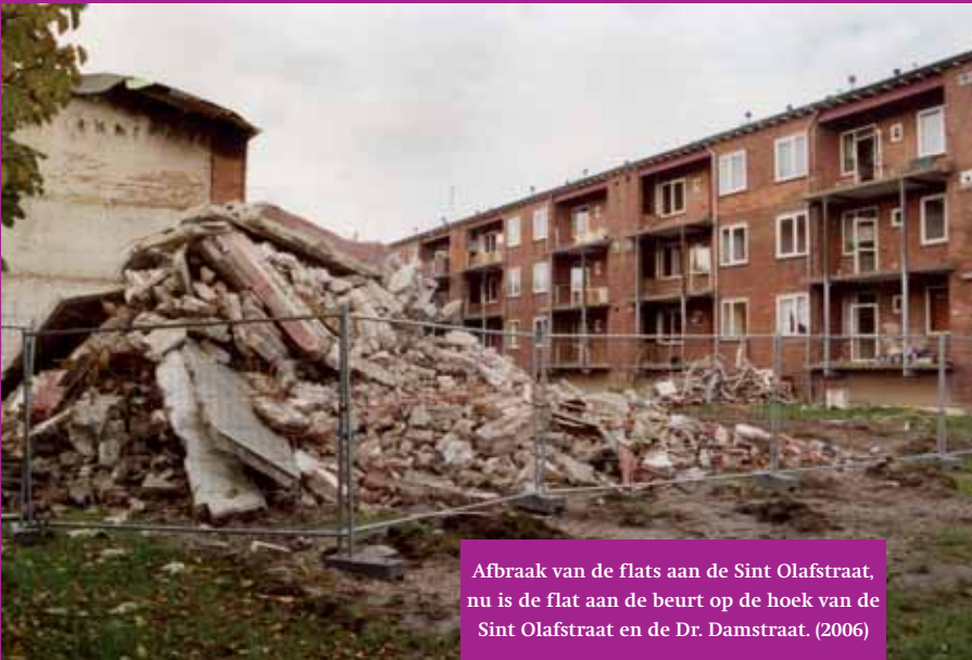
Afbraak van de flats aan de Sint Olafstraat, nu is de flat aan de beurt op de hoek van de Sint Olafstraat en de Dr. Damstraat. (2006)