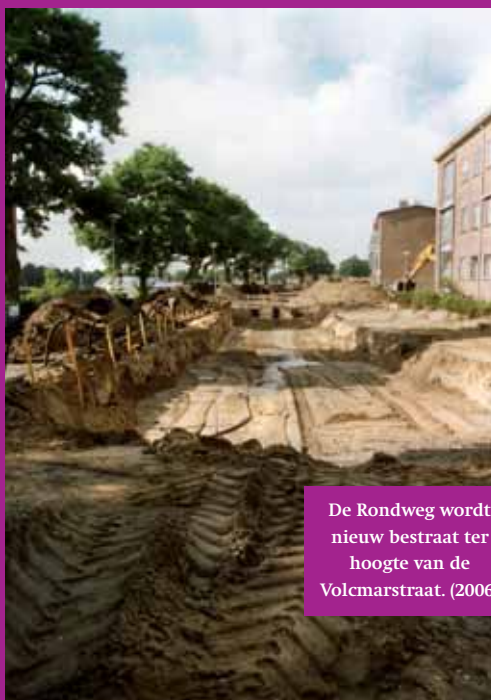
De Rondweg wordt nieuw bestraat ter hoogte van de Volmarstraat. (2006)