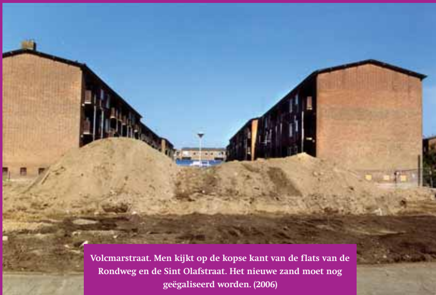
Volmarstraat. Men kijkt op de kopse kant van de flats van de Rondweg en de Sint Olafstraat. Het nieuwe zand moet nog geëgaliseerd worden. (2006)