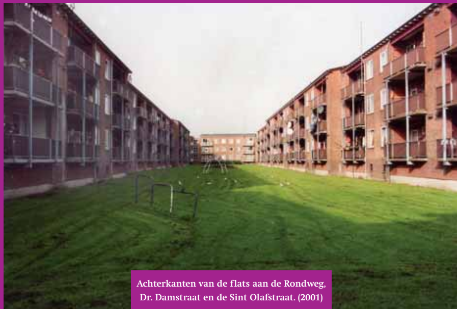
Achterkanten van de flats aan de Rondweg, Dr. Damstraat en de Sint Olafstraat. (2001)