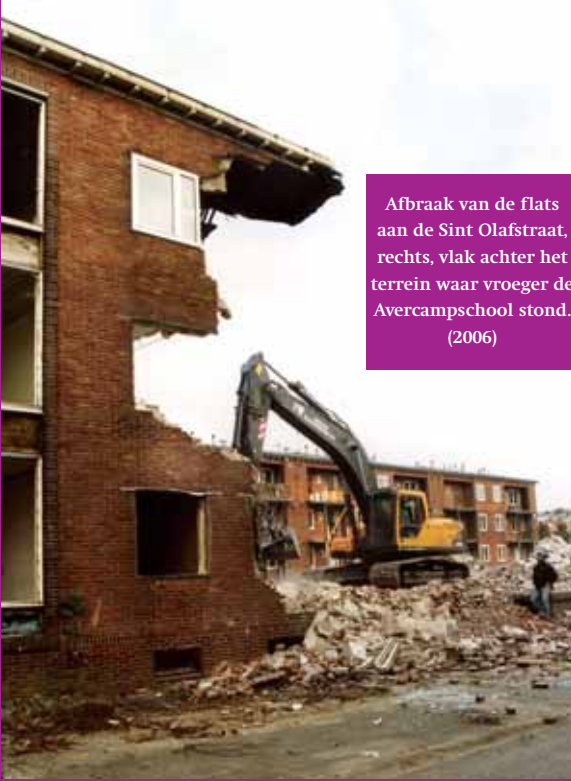
Afbraak van de flats aan de Sint Olafstraat, rechts, vlak achter het terrein waar vroeger de Avercampschool stond. (2006)