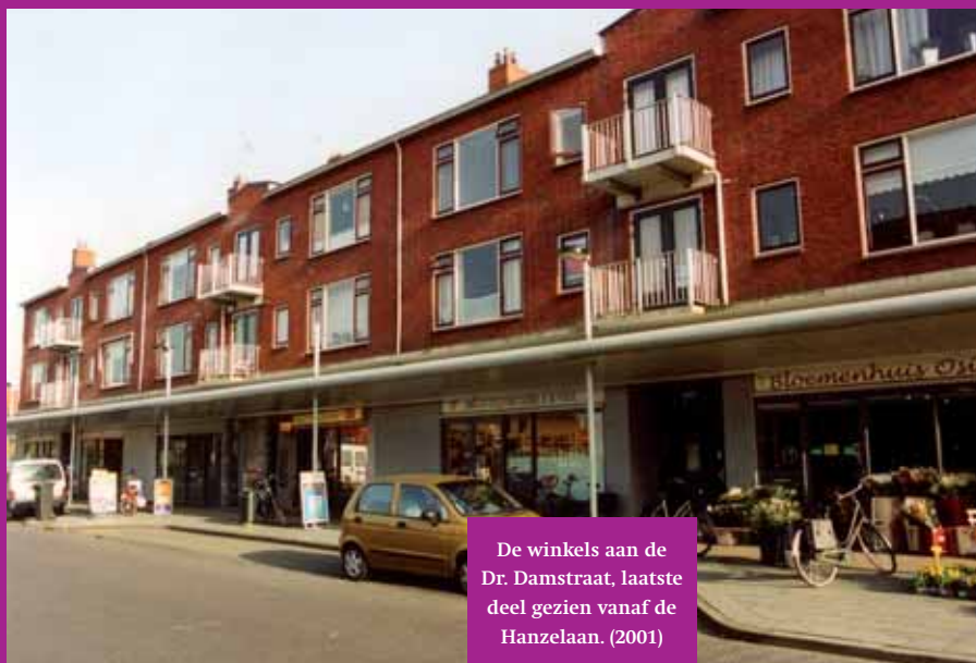
De winkels aan de Dr. Damstraat, laatste deel gezien vanaf de Hanzelaan. (2001)