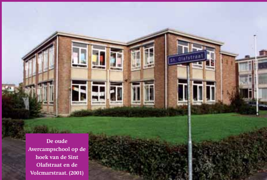
De oude Avercampschool op de hoek van de Sint Olafstraat en de Volcmarstraat. (2001)