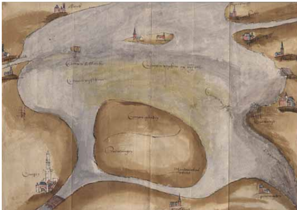
Kaart uit 1534 met daarop de visgronden van Kampen weergegeven.

beslag te kunnen leggen op al het binnen die lijn gelegen water. Halverwege de uitloop van de Gelderse Gracht en Schokland troont prominent de 'Camper bolbaecke', een baken bestaande uit een ton op een staketsel, die een waarschuwing was voor alle Friese (maar vooral ook Hollandse en Gelderse) vissers dat ze vreemd gebied naderden. Daar direct onder staat de aanduiding 'Camper visscherien' en die woorden worden herhaald in het gedeelte van de Zuiderzee vóór de Voorst. Dat er daarnaast rechten van Vollenhove en Genemuiden waren blijft onvermeld; bij de grensafbakening met de andere gewesten deden ze ook niet ter zake. Maar alsof dat nog niet genoeg was staat in de zee onder Schokland geschreven 'Camper vryheit op III 1 / 2 elle'. Dit betekent dat alle gronden die minder dan ongeveer 2,4 meter diep waren automatisch tot de stad behoorden. Een dergelijke maat werd ook door de vissers van Vollenhove aangehouden, al komt soms 3 1 / 2 voet (ruim één meter) als aanduiding voor. 9 Uiteraard probeerde men er vaak méér uit te halen dan waar men recht op had; dat gold zeker voor Kampen.