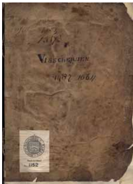
Omslag eerste pachtregister visserij.

‘stekken’ weer onderverhuurde aan zijn medeburgers. Tevens zal het contract voor een aantal jaren hebben gegolden, want tot en met 1329 wordt er door of namens Piscator voor deze visrechten betaald. Vanaf 1331 is er sprake van jaarlijkse verpachtingen, aan een groep van ten minste drie en ten hoogste zes à zeven personen, die daarvoor 25 tot 30 pond per jaar betalen en soms zelfs een hogere som. Ze staan opgetekend in de ‘Oudste Foliant’ in het stadsarchief, aanvankelijk nog in het Latijn, maar vanaf 1338 in de volkstaal. De verpachtingen vinden steeds plaats in de zomer, in het algemeen tussen Petrus en Paulus (29 juni) en Sint Margriet (20 juli). De betaling van de pachtsom dient