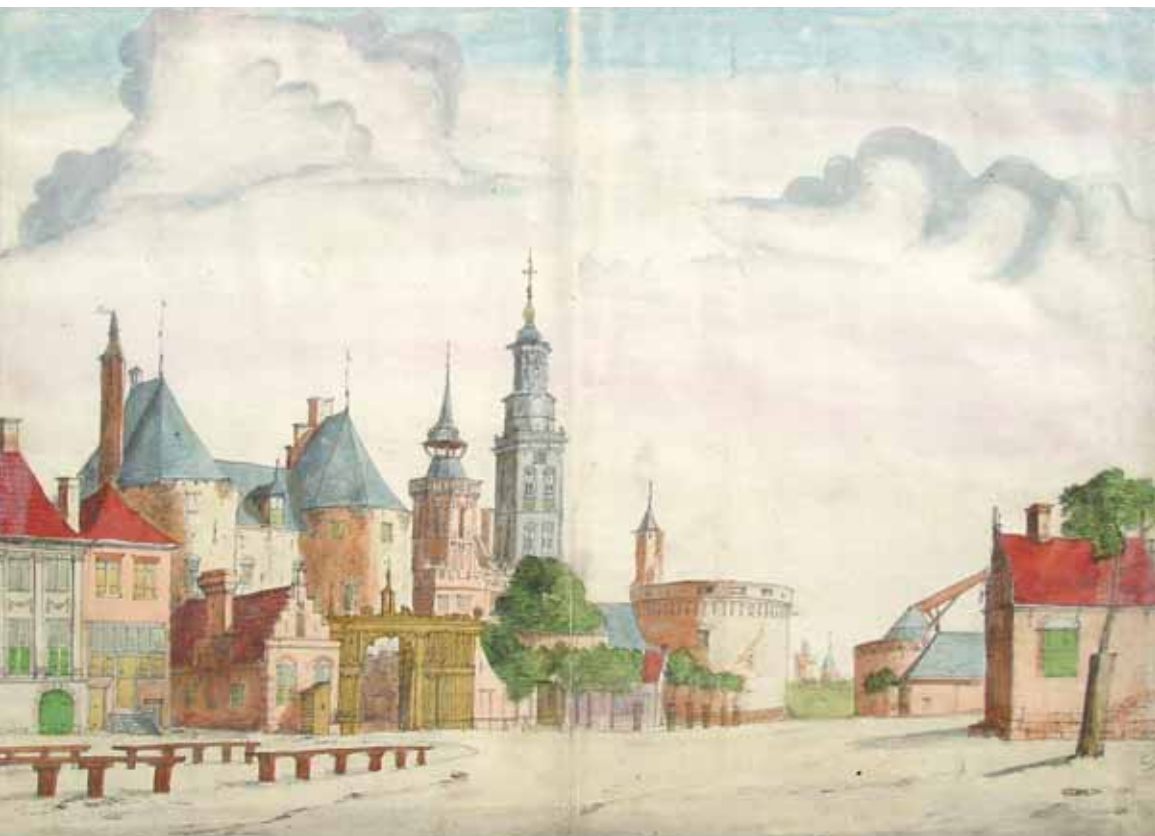
De IJsselkade met links de Vispoort vanuit het zuidoosten, door A. Beerstraten, circa 1665.

De visserij was in de late middeleeuwen en de tijd van de Republiek voornamelijk een stedelijke aangelegenheid. Dat was niet altijd zo geweest. Aanvankelijk was de visserij vrij in die zin dat ingezetenen altijd voor eigen