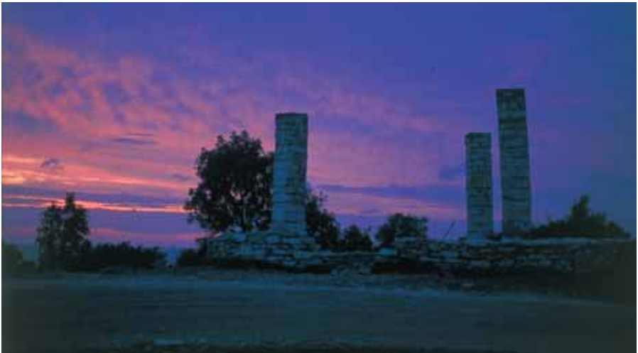
De restanten van de Middeleeuwse galg van Visby op het eiland Gotland (Foto: Theo van Mierlo).

Over het 'gerichte' buiten de Venepoort is meer bekend. Het is afgebeeld op een zeventiende-eeuwse gravure van W. Hollar (1609-1677). Het lijkt een royaal bouwwerkje dat voor de kaak in het centrum niet onderdeed. Het doet denken aan de nog bestaande terechtstellingsplaats op de Galgenberg bij Visby op het Zweedse eiland Gotland in de Oostzee. De stenen galg buiten de Venepoort was juist daar geplaatst om reizigers die de stad vanuit het zuiden naderden, ontzag in te boezemen voor de rechtspleging in Kampen. Betalingen aan ambachtslieden maken duidelijk dat er slechts af en toe reparaties werden uitgevoerd. Zo trakteerde men in 1606 een ploeg metseelaars die de stenen onderbouw herstelde, op een flinke hoeveelheid 'Croens' bier. 94