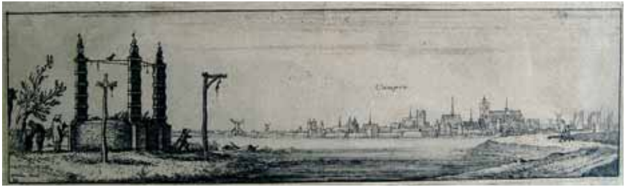
Gezicht op de stad Kampen, vanaf de IJsseldijk buiten de Venepoort, met links op de voorgrond de galg; een ets van Wenzel Hollar (1609-1677).