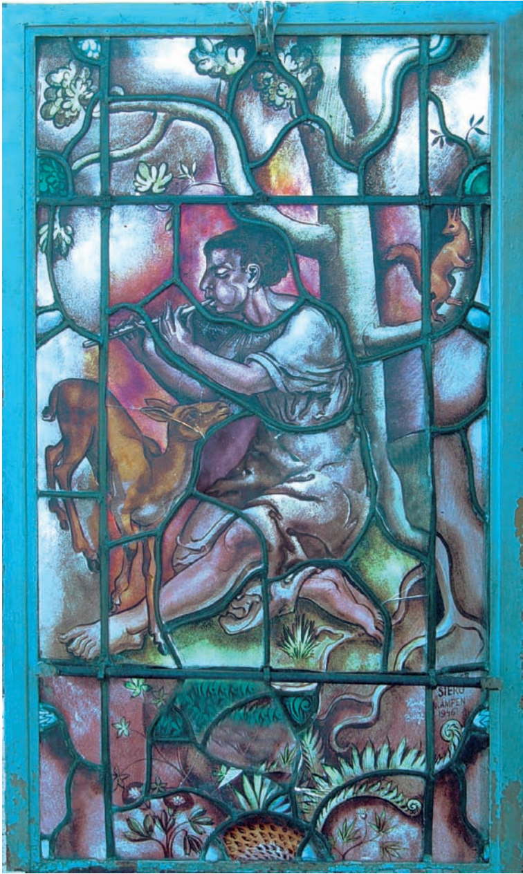
Het beschadigde glas-in-lood raam van de god Pan.