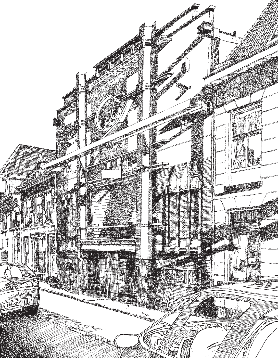
Voorgevel City-theater aan de Boven Nieuwstraat voorjaar 2005; pentekening door Hans van der Horst.