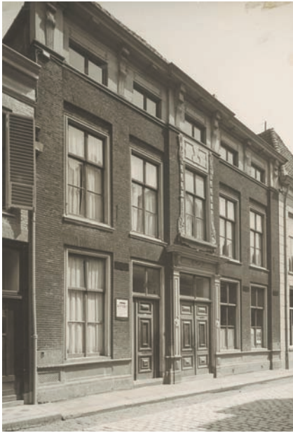
Voorgevel van het gebouw van Christelijke Belangen, een monumentaal 18de eeuws pand dat in 1940 moest wijken voor de bouw van het City-Theater.

voor Handel en Nijverheid (C.H.L. Lijs) blijven steken in de gebruikelijke gemeenplaatsen, waarna de openingsvoorstelling kan beginnen. 6