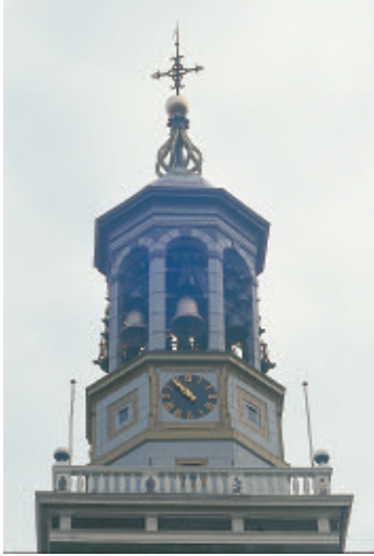
De door Philip Vingboons ontworpen lantaarn van de Nieuwe Toren, met het carillon van François Hemony.

klokspijs in, ‘weesende (door de brand) vuyl ende daeronder veel quaet goets’. 127