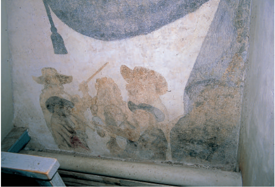
Muurschildering van musicerende mensen, thans achter het orgel in de Bovenkerk, maar oorspronkelijk vanuit de kerkruimte zichtbaar, ca. 1687(?). Hebben we hier wellicht te maken met leden van het Collegium Musicum?