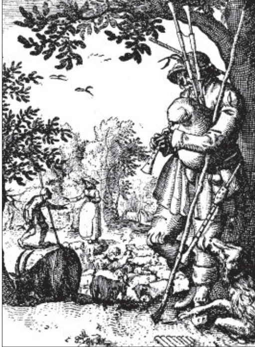
Gravure uit het begin van de 17de eeuw van een doedelzakspeler. Rechts aan zijn gordel hangt nog een schalmey. (Afb. uit: J.R. Schiltmeijer, Nederland in de Gouden Eeuw.)